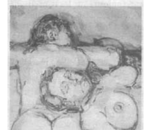
Pour le peintre de Morlanwelz, le nu a toujours été une évidence.