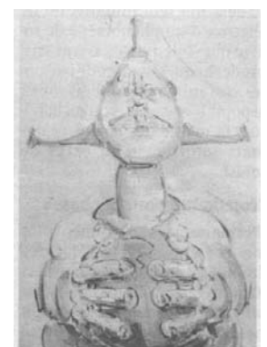
Eve maghienne. Etrange et douce. Mais la tendresse est une force...