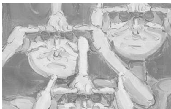
Un peuple observateur. A moins que ce ne soit nous, les voyeurs? Repro. D.C.